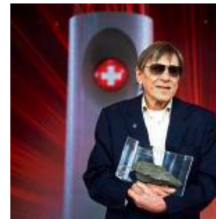
Polo Hofer hat Prinzipien.

SRF-Sprecherin auf Anfrage der «Zentralschweiz am Sonntag». Hofers Marotten zeigen sich auch bei den Planungen für den Empfang des «Schweizer des Jahres», der traditionell im Sommer auf der Älggialp in Obwalden stattfindet. Erstmals wird der Anlass auf den Nachmittag verlegt. Dem Nachtmenschen Hofer war der Empfang um 9.30 Uhr in Sachseln zu früh. CHI